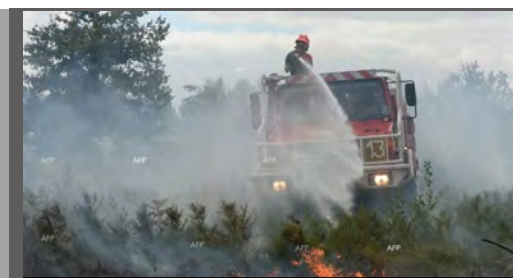
Над 600 хектара изгоряха край Бордо, Югозападна Франция. 26 юли 2015.