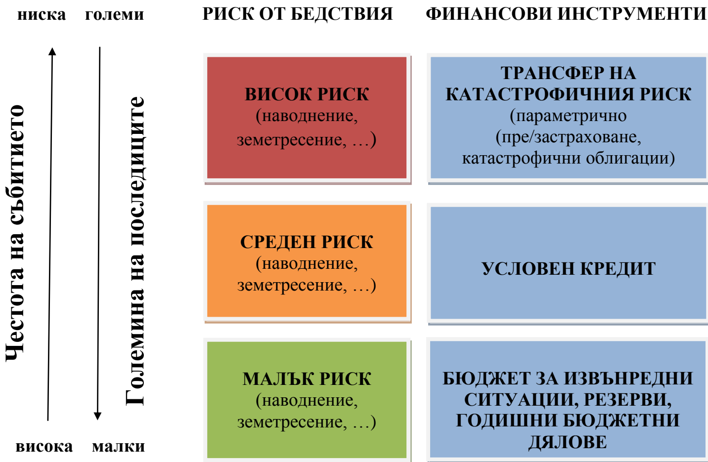
Схема № 2 - модел за финансово управление на риска от бедствия

Необходимо е изборът на съответните финансови механизми да бъде съобразен с потребността от ресурси във времето. При настъпване на бедствие със значителен мащаб, властите трябва да са в състояние да предприемат бързи и ефикасни действия по реагиране и възстановяване на основните услуги и инфраструктура. Фазата на възстановяване трябва да се основава на предварително планирани действия, които да не допускат създаването на същите рискови условия, довели до настъпване на бедствието. Следва да се съобрази и възможността от даване на приоритет на някои проекти за намаляване на риска от бедствия с цел постигане на по-добри резултати.