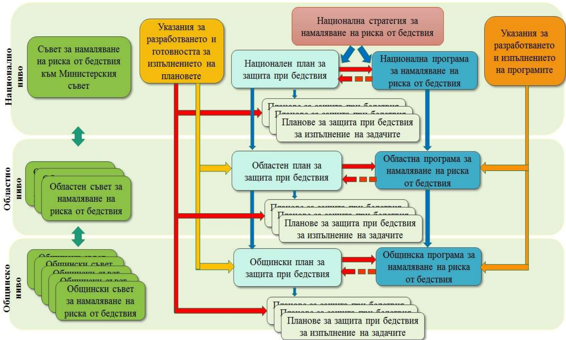
Схема № 1 – връзка между стратегическите и планиращи документи отнасящи се до защитата при бедствия